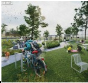
Koncepcja nr 1

• wzniesienie balustrady. Na powierzchni placu zabaw/miasteczka łąka kwietna. W otoczeniu strefy są siłownia/rowerowe ścieżki z taflami wodnymi i parkietem drewnianym (niekwalifikującym)