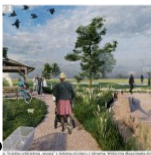
Koncepcja nr 1