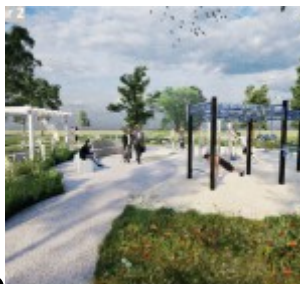
Koncepcja nr 2

• wykonanie osłony rowerowej, 2 ławki, strefa zabaw/miasteczka dla dzieci, 2 parkingi rowerowe. Na powierzchni 4 strefy strefy rekreacji strefa strefy zabaw/miasteczka, a placu zabaw/obszary funkcyjnej strefy rekreacji. Położenie: planuje 10 miejsc parkingowych (niekwalifikujących) dla samochodów