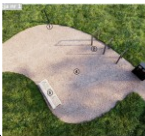
Koncepcja nr 1