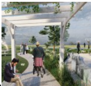
Koncepcja nr 2

• wykonanie osłony rowerowej, 2 ławki, strefa zabaw/miasteczka dla dzieci, 2 parkingi rowerowe. Na powierzchni 4 strefy strefy rekreacji strefa strefy zabaw/miasteczka, a placu zabaw/obszary funkcyjnej strefy rekreacji. Położenie: planuje 10 miejsc parkingowych (niekwalifikujących) dla samochodów